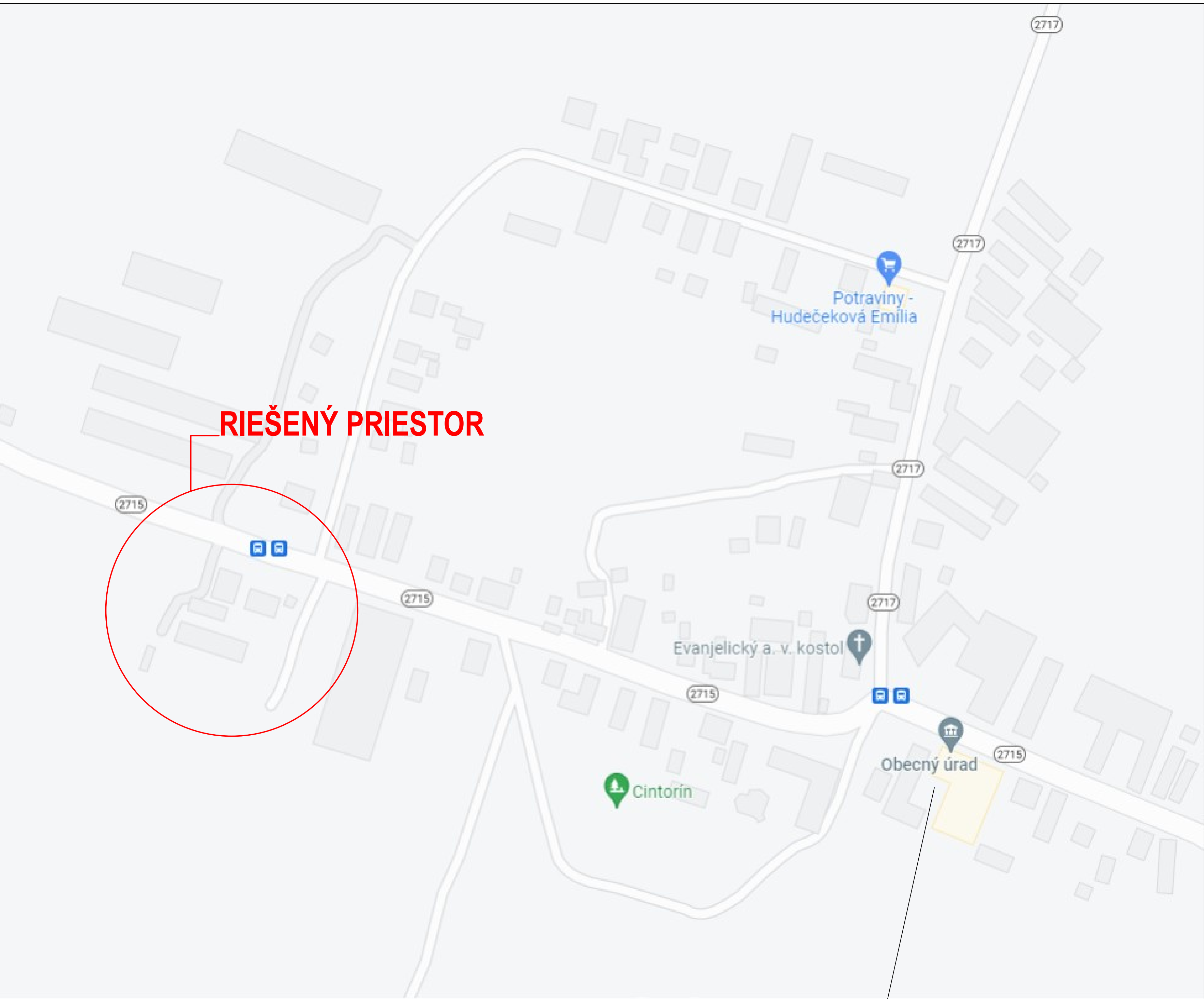
SITUÁCIA ŠIRŠÍCH VZŤAHOV